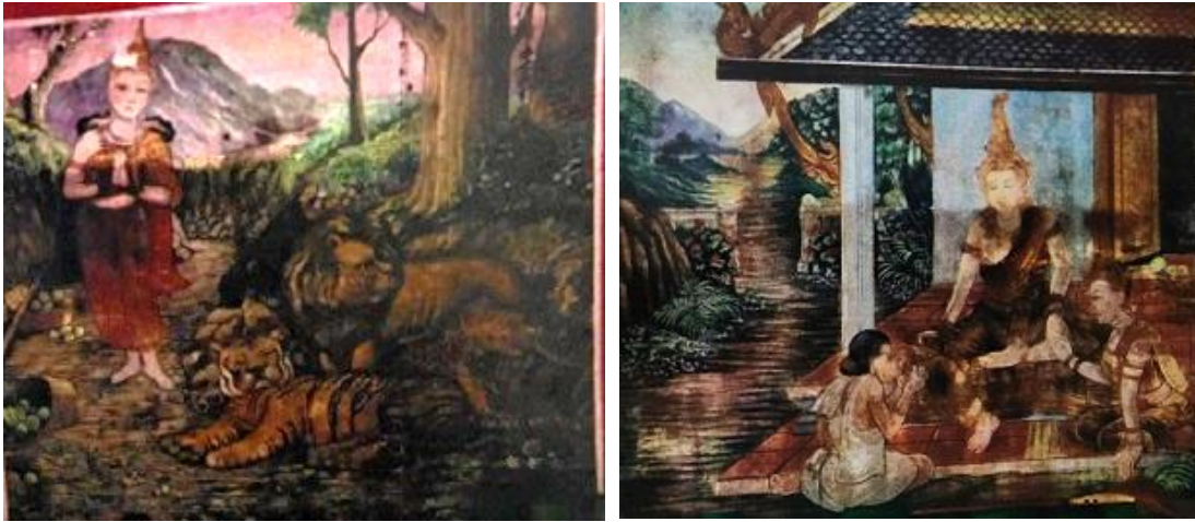
ภาพที่ 8 จิตรกรรมฝาผนังวัดไผ่ล้อม ภาพพระเวสสันดรชาดก