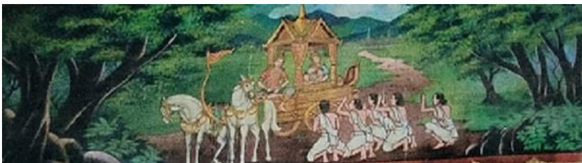
ภาพที่ 7 จิตรกรรมฝาผนังวัดเสาหิน ภาพพระเวสสันดรชาดก