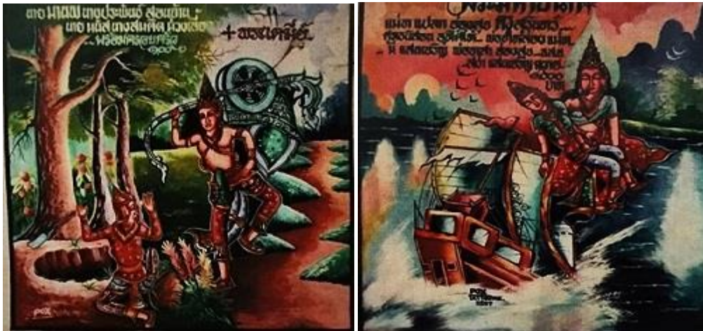
ภาพที่ 4 จิตรกรรมฝาผนังวัดดอยมูล ภาพทศชาติชาดก

ภาพจิตรกรรมฝาผนังเรื่องทศชาติชาดก ดังปรากฏใน (ภาพที่ 4) จิตรกรรมฝาผนังวัดดอยมูล และ (ภาพที่ 5) วัดโพธิ์ทอง ภาพเนื้อหาเรื่องทศชาติจะแสดงถึงการบำเพ็ญบารมีในแต่ละพระชาติเป็นการประพฤติปฏิบัติตามหลักพระพุทธศาสนาเพื่อจุดมุ่งหมายสู่นิพพาน และในพระชาติสุดท้าย (ภาพที่ 6) จิตรกรรมฝาผนังวัดทองลับแล (ภาพที่ 7) วัดเสนาหิน (ภาพที่ 8) วัดไผ่ล้อม และ (ภาพที่ 9) วัดฝักราภภาพพระเวสสันดรชาดก แสดงให้เห็นถึงความสำคัญของพระชาติสุดท้ายในทศชาติชาดก เป็นการบำเพ็ญบารมีอันยิ่งใหญ่ และนำไปสู่การจุติเป็นพระสัมมาสัมพุทธเจ้า