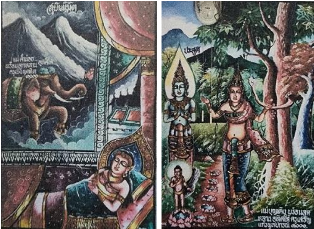
ภาพที่ 10 จิตรกรรมฝาผนังวัดดอยมูล ภาพพุทธประวัติ