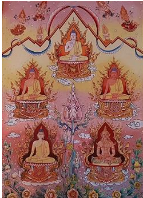
ภาพที่ 1 จิตรกรรมฝาผนังวัดพระแท่นศิลาอาสน์ ภาพภัทรกัป คือ มีพระพุทธเจ้า 5 พระองค์

จิตรกรรมฝาผนัง (ภาพที่ 1) จิตรกรรมฝาผนังวัดพระแท่นศิลาอาสน์ ภาพภัทรกัป คือ มีพระพุทธเจ้า 5 พระองค์ สะท้อนความเชื่อว่าพระพุทธเจ้ามีจริง และเชื่อว่ามีในภัทรกัปเป็นกัปที่เจริญที่สุด มีพระพุทธเจ้าเกิดขึ้นในโลกนี้ถึง 5 พระองค์ คือ พระกกุสันโธ พระโกนาคมน โพระกัสสโป พระโคตโม และพระศรีอริยเมตไตรโย แสดงถึงความศรัทธาในพระพุทธศาสนาความเชื่อในการเวียนว่ายตายเกิด และการสั่งสมบุญบารมีเพื่อมุ่งสู่นิพพาน พจนานุกรมราชบัณฑิตยสถาน (2554 : 635) ได้ให้ความหมายของ นิพพาน ไว้ว่า ความดับสนิทแห่งกิเลสและกองทุกข์