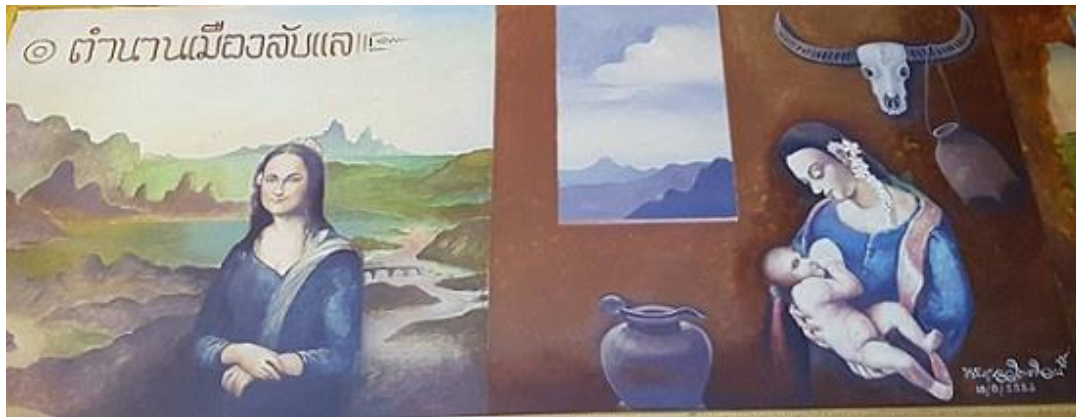
ภาพที่ 13 จิตรกรรมฝาผนังวัดพระแท่นศิลาอาสน์ ตำบลน่านเมืองลับแล