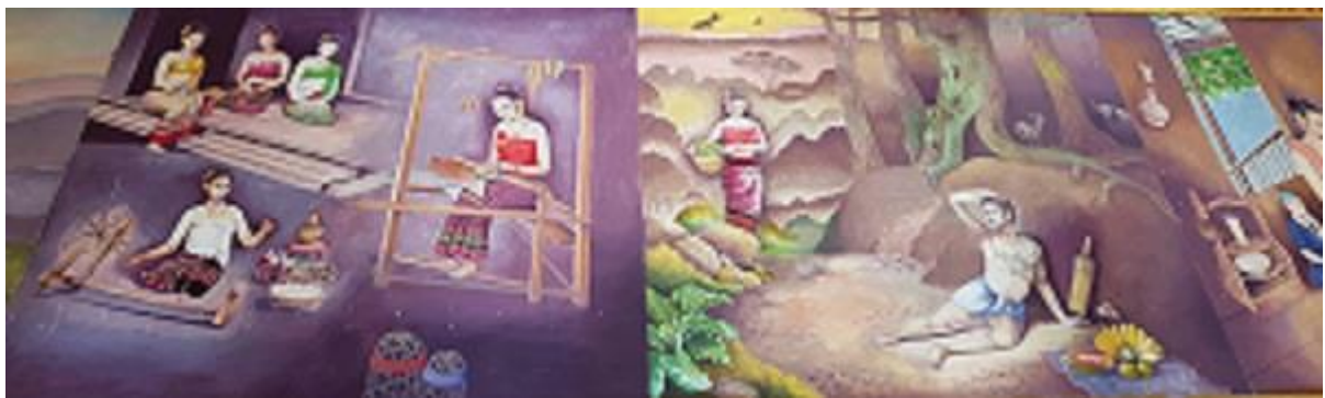
ภาพที่ 14 จิตรกรรมฝาผนังวัดพระแท่นศิลาอาสน์ ตำบลน่านเมืองลับแล

5. พระมหากษัตริย์ทรงเป็นเอกอัครศาสนูปถัมภก พระราชกรณียกิจที่สำคัญของพระมหากษัตริย์และพระบรมวงศานุวงศ์ของไทย คือ การทำนุบำรุงและสืบสานพระพุทธศาสนาให้ยั่งยืนสืบไป ดังปรากฏในภาพจิตรกรรมฝาผนัง (ภาพ 15) วัดพระแท่นศิลาอาสน์ แสดงภาพพระมหากษัตริย์ไทยทุกพระองค์ และพระบรมวงศานุวงศ์ได้ทรงอุปถัมภ์พระพุทธศาสนาอย่างดียิ่งตลอดมา โดยทรงอุปถัมภ์ในทุก ๆ ด้าน อาจกล่าวได้ว่าพระพุทธศาสนานั้นถึงแม้ว่าจะดำรงคงอยู่เฉยๆ โดยไม่มีผู้อุปถัมภ์ย่อมไม่ได้ แท้จริงพระพุทธศาสนาจะเจริญรุ่งเรืองและอยู่ยั่งยืนมั่นคงก็ด้วยอาศัยผู้นำประเทศ คือพระมหากษัตริย์เป็นผู้สนับสนุนและทำนุบำรุง เพราะพระมหากษัตริย์ทรงมีพระราชอำนาจเต็มที่ในอันที่จะทรงอำนวยความสะดวกอุปถัมภ์และส่งเสริมได้มากกว่ายิ่งกว่าบุคคลใดๆ อาทิ การสร้างวัดวาอาราม ซ่อมแซมปฏิสังขรณ์ปูชนียสถานต่าง ๆ ทางพุทธศาสนา ตลอดจนถวายนิยัตินิตยภัตเป็นเครื่องบำรุงเลี้ยงพระสงฆ์ เป็นต้น พระมหากษัตริย์จึงทรงอยู่ในฐานะอันเลิศฝ่ายอุปถัมภ์พระพุทธศาสนาให้เจริญวัฒนาถาวรโดยลำดับมา เรียกว่าเป็นเอกอัครศาสนูปถัมภก และพระมหากษัตริย์ก็ทรงต้องพึ่งพาพระพุทธศาสนา เพราะพระพุทธศาสนาเป็นหลักใจ เป็นที่ยึดเหนี่ยว และเป็นเครื่องส่องสติปัญญาให้พระมหากษัตริย์ทรงประพฤติ ปฏิบัติ และดำเนินไปในทางถูกต้อง