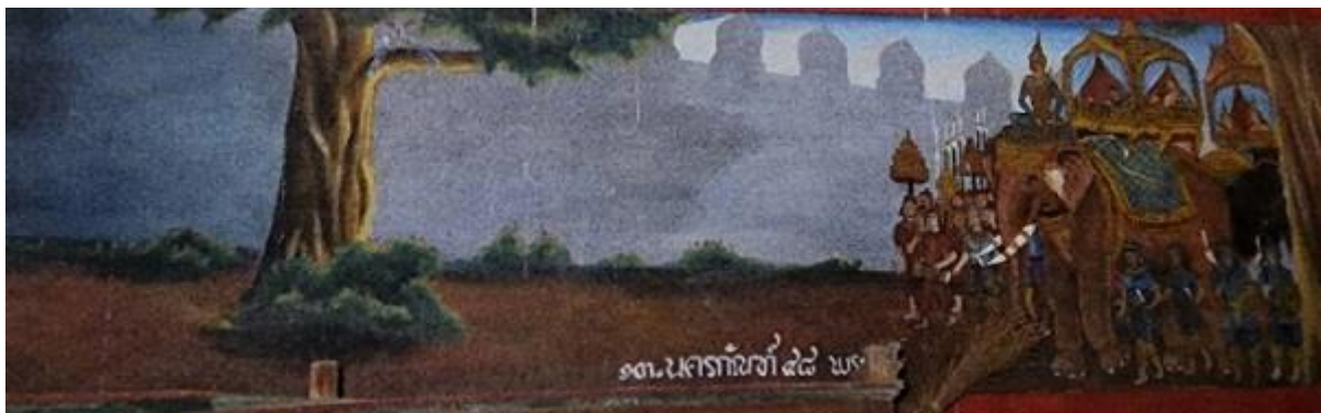
ภาพที่ 9 จิตรกรรมฝาผนังวัดฝักราก ภาพพระเวสสันดรชาดก

2. เรื่องพุทธประวัติ กล่าวถึงเหตุการณ์สำคัญตอนที่เสวยพระชาติเป็นเจ้าชายสิทธัตถะ เริ่มเรื่องราวตั้งแต่เทวดาชุมนุมอัญเชิญพระโพธิสัตว์ให้จุติเพื่อมาตรัสรู้เป็นพระพุทธเจ้า และพระนางสิริมหามายาทรงสุบินนิมิต ประสูติ เสด็จออกผนวช ผจญมาร ตรัสรู้ สั่งสอนธรรม โปรดพระประยูรญาติ และพระมารดาบนสวรรค์ เสด็จดับขันธปรินิพพาน งานถวายเพลิงพระบรมศพ การแบ่งพระบรมสารีริกธาตุ และพิธีสมโภชพระบรมสารีริกธาตุ