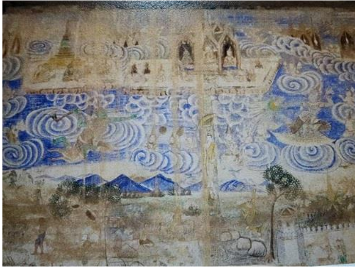
ภาพที่ 2 จิตรกรรมฝาผนังวัดฝักราก ภาพสรรคภูมิ บรรดาเทวดาที่เกิดในสวรรค์ 6 ชั้น