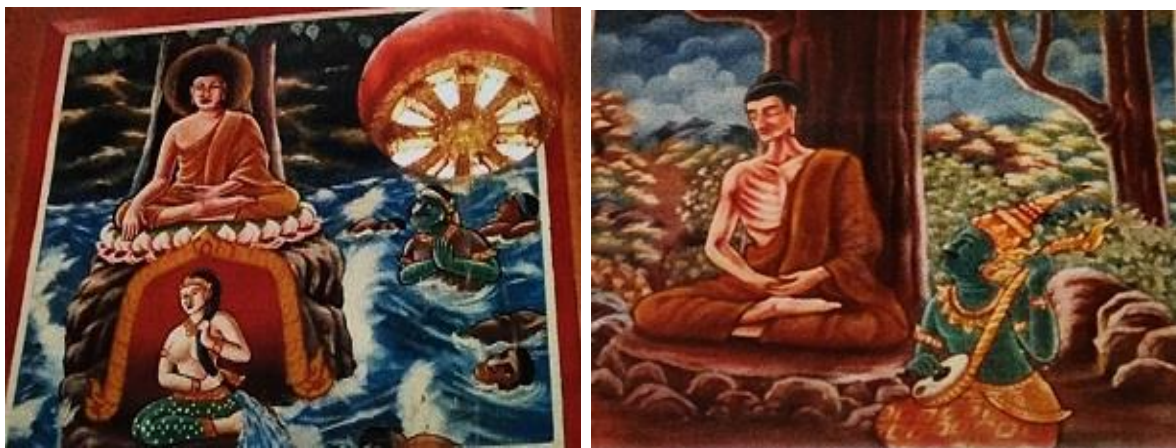
ภาพที่ 11 จิตรกรรมฝาผนังวัดไผ่ล้อม ภาพพุทธประวัติ