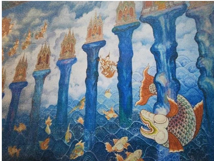
ภาพที่ 3 จิตรกรรมฝาผนังวัดพระยืนพุทธบาทยุคล ภาพเขาพระสุเมรุ และปลาอานนท์

1. เรื่องทศชาติชาดก เป็นเรื่องราวที่แสดงการบำเพ็ญทศบารมีในสิบพระชาติสุดท้ายของพระโพธิสัตว์ เป็น 10 พระชาติสุดท้ายที่ทรงบำเพ็ญบารมีอันยิ่งใหญ่ที่เรียกว่ามหาบารมีก่อนตรัสรู้เป็นพระพุทธเจ้า ได้แก่ (1) พระเตมีย์ ทรงบำเพ็ญเนกขัมมบารมี คือ ความอดทนสูงสุด (2) พระมหาชนก ทรงบำเพ็ญวิริยบารมี คือ ความพากเพียรสูงสุด (3) พระสุวรรณสาม ทรงบำเพ็ญเมตตาบารมี คือ ความเมตตาสูงสุด (4) พระเนมิราช ทรงบำเพ็ญอุชิฐานบารมี คือ ความมีจิตที่แน่วแน่มบูรณ์ (5) พระมโหสถ ทรงบำเพ็ญปัญญาบารมี คือ ความมีปัญญาสูงสุด (6) พระกัณฐก ทรงบำเพ็ญศีลบารมี คือ ความมีศีลที่สมบูรณ์สูงสุด (7) พระจันทกุมาร ทรงบำเพ็ญขันติบารมี คือ ความอดกลั้นสูงสุด (8) พระนารทพรหม ทรงบำเพ็ญอุเบกขาบารมี คือ การมีอุเบกขา