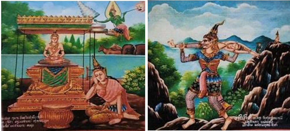
ภาพที่ 5 จิตรกรรมฝาผนังวัดโพธิ์ทอง ภาพทศชาติชาดก