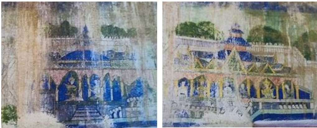
ภาพที่ 6 จิตรกรรมฝาผนังวัดทองลับแล ภาพพระเวสสันดรชาดก