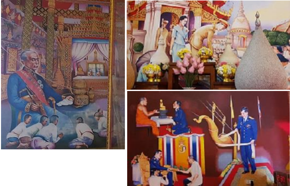
ภาพที่ 15 จิตรกรรมฝาผนังวัดพระแท่นศิลาอาสน์ ภาพพระราชกรณียกิจของพระมหากษัตริย์ และพระบรมวงศานุวงศ์ของไทย