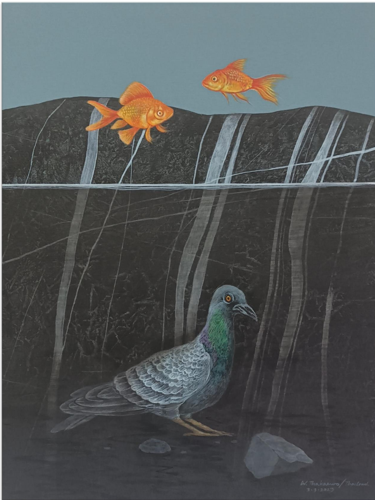
ภาพที่ 1 ชื่อภาพ “เมื่อปลาอยู่บนฟ้า แล้วนกอยู่ในน้ำ” (When Fishs On The Sky and Bird In The Water)