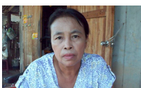
ลชัยภูมิพล